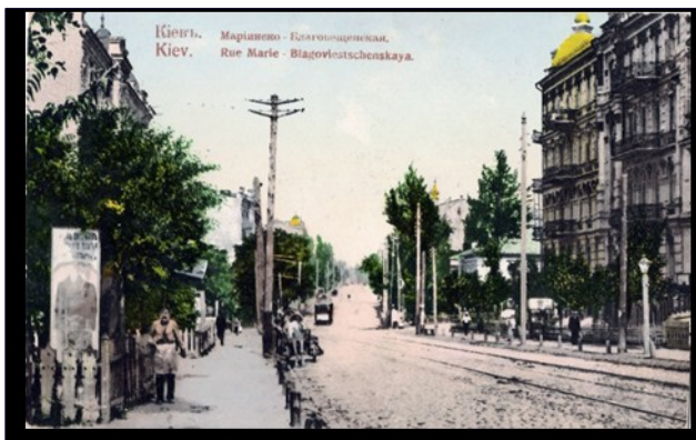
Київ, вул. Маріїнсько-Благовіщенська (листівка поч. XX ст.), тут у буд. №67 мешкала родина Грінченків (1905-1909рр.)

Для вшанування титанічної праці Бориса Дмитровича Київським університетом імені Бориса Грінченка у квітні 2010 р. було відкрито історико-біографічний музей. У ньому широко представлено життєвий і творчий шлях письменника, його внесок у в українську культуру.