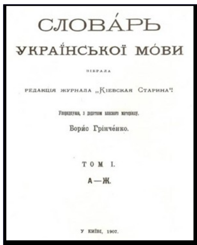
«Словарь української мови», 1907 р.

Експозиція репрезентує рідкісні світлини, фотонатурні листівки з видами старих міст: Харкова, Херсона та Києва, у яких жив і працював письменник. Привертають увагу відвідувачів рідкісні поштові листівки з портретами Б.Д.Грінченка, табличка з дверей квартири №6 на Гоголівській вул. 8, м Києва, у якій вчений створив славнозвісний Словник..