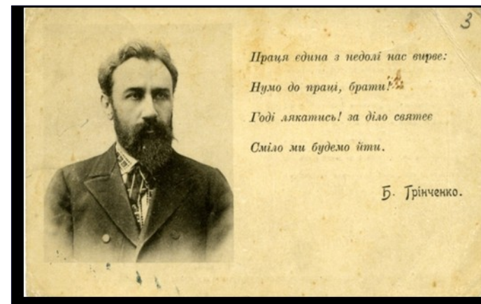
Листівка 1907р. з портретом Б.Д.Грінченка, кошти від продажу якої призначалися на спорудження пам'ятника Т.Г. Шевченкові в Києві.

Чимало експонатів – це матеріали архіву одного з перших біографів Б.Д.Грінченка Миколи Плевака, що подаровані професором-грінченкознавцем В.В.Яременком.